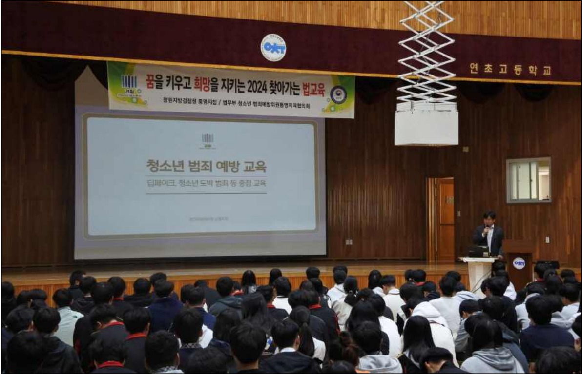
시청각 자료를 활용한 강의 진행