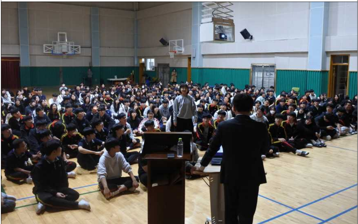
퀴즈에 적극 참여하는 학생들