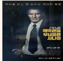
백악관을 무너뜨린 사나이(2017)