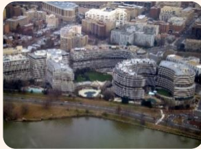
사건이 발생한 워터게이트 복합단지

닉슨은 도청 사건과 백악관과의 관계를 부인하였으나 진상이 규명됨에 따라 대통령보좌관 등이 관련되어 있음이 밝혀졌고, 대통령 자신도 무마공작에 나섰던 사실이 폭로되어 닉슨 정권의 선거방해, 정치헌금의 부정·수취 및 탈세 등이 드러나게 되었습니다. 결국 1974년 8월 대통령탄핵 결의가 가결됨에 따라 닉슨은 대통령직을 사임할 수밖에 없게 되었지요.