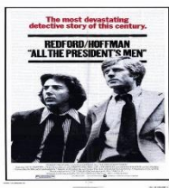
모두가 대통령의 사람들(1976)