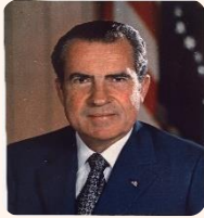
리처드 닉슨 (Richard Milhous Nixon) 미국의 제 37대 대통령

미국 워터게이트사건(Watergate Scandal)은 1972년 6월 리처드 닉슨 대통령의 재선을 도모하는 비밀공작반이 워싱턴 D.C. 내 워터게이트 복합단지에서 있는 상대당 전국위원회 본부에 침입하여, 도청장치를 설치하려다 발각된 정치적인 사건입니다.