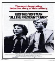
모두가 대통령의 사람들(1976)