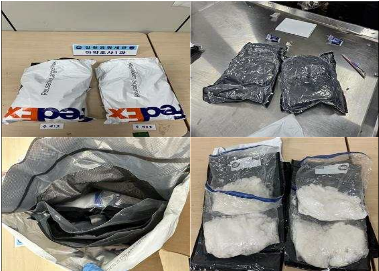
[사진] 국제우편물로 위장한 필로폰 3kg 압수물