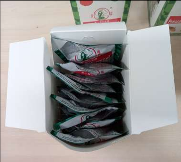
[젤리 위장 포장]