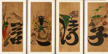
'효제충신'이 그려진 문자도

글자인 듯 그림인 듯 어딘지 친숙한 위 그림은 민화인 한 종류인 문자도입니다.