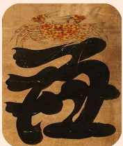
'게'가 그려진 '염'자도

꽃글씨, 서화도로도 불렸던 그림 속 각각의 글자에는 한자의 뜻과 관계있는 고사의 동식물을 그려넣어 의미를 생각할 수 있도록 하였으며, 주로 유교적 윤리관이나 풍수사상, 소망 등을 주제로 표현하였습니다. 제일 많이 그려진 것은 효제충신 예의염치(孝悌忠信 禮義廉恥) 를 그린 효제문자도 로 조상들은 이를 병풍으로 만들어 집안에 두고 그 덕목을 되새겼다고 합니다.